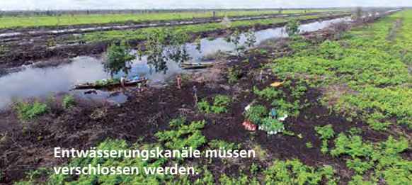
Entwässerungskanäle müssen verschlossen werden.