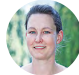
Text von Sophia Benz