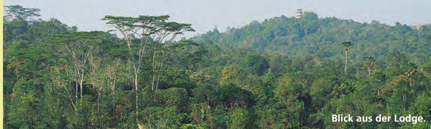
Blick aus der Lodge.