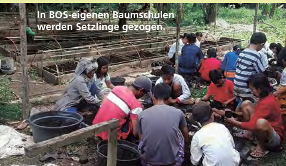
In BOS-eigenen Baumschulen werden Setzlinge gezogen.

Neue OTOL-Sponsoren: Die One-Tree-One-Life-Kampagne startete im November 2019 in eine weitere Runde! Als Sponsoren neu dabei sind: haudejacobian, Lush Schweiz, Custom Campers, Alternate Notes, Spalantor Optik GmbH, Milo Interieur, Lision, Carbon Connect, Green Things, Outdoorland AG und mimi + bob.