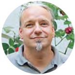
Text von Matthias Müller

Ende September wurde das Orang-Utan-Männchen Sapat von Gewehrkugeln durchlöchert auf einer Palmölplantage gefunden. Seine Geschichte macht wütend, traurig und wirft die Frage auf: Haben Orang-Utans eigene Schutzengel oder hatte Sapat einfach Glück?